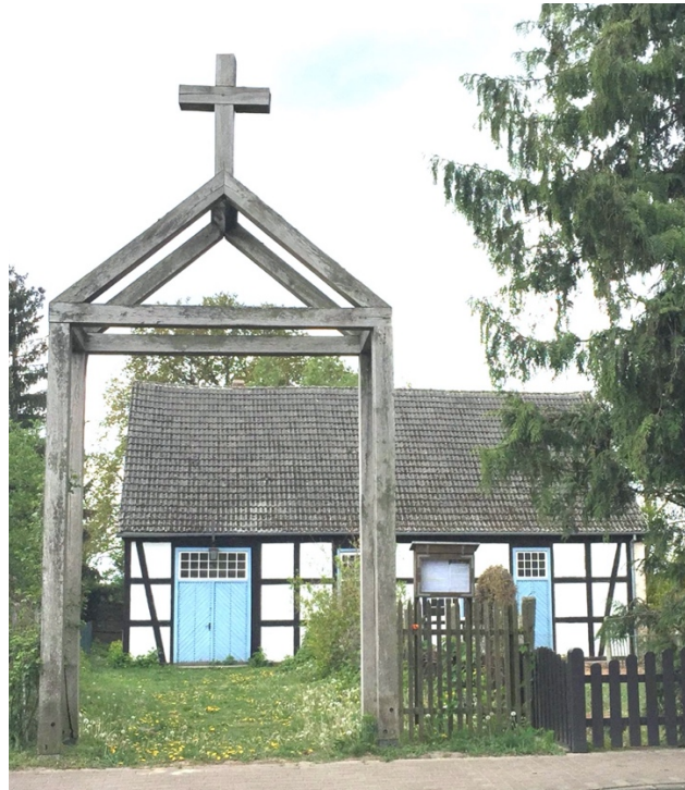
Die Scheunenkirche in Wilmersdorf

Bitte senden Sie das ausgefüllte und unterschriebene Beitrittsformular als Foto oder Scan per E-Mail an vorstand@scheunenkirche.de oder per Post an den Förderverein Scheunenkirche e.V., Straße zum Bahnhof 4, 16278 Wilmersdorf (Angermünde)